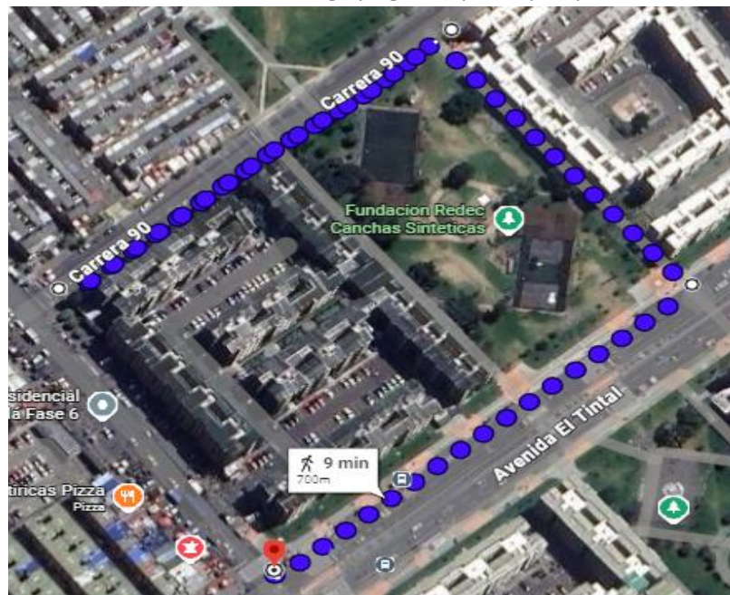
Imagen 1. https://maps.app.goo.gl/PfPWH8MrKxcwq86h8

DESARROLLO: Una vez reunida el Área Gestión Político Jurídico de la alcaldía local de Kennedy se contactó con el subintendente encargado de la estación octava de policía de la localidad de Kennedy para el desarrollo del operativo a los bares con mayor impacto en la localidad de Kennedy.